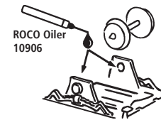
ROCO Oiler 10906

Les pièces de finition illustrées sont à monter par le modéliste. Le jeu de pièces peut comprendre d'autres pièces (non illustrées) qui sont destinées à autres versions du modèle et qui sont superflus à la variante présente.